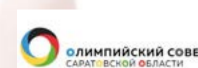
«Олимпийский совет Саратовской области»